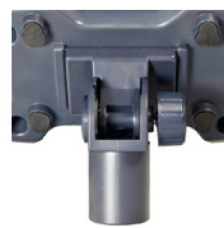
Support pour colonne