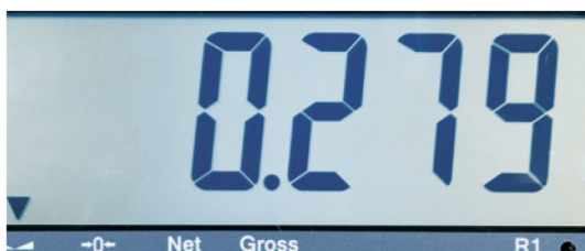
Écran LCD rétroéclairé