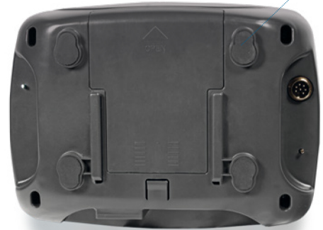
Détail de la fixation