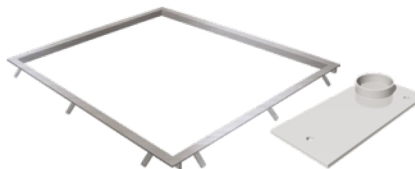
Encadrement de fosse inoxydable avec plaques d'ancrage (4 unités)